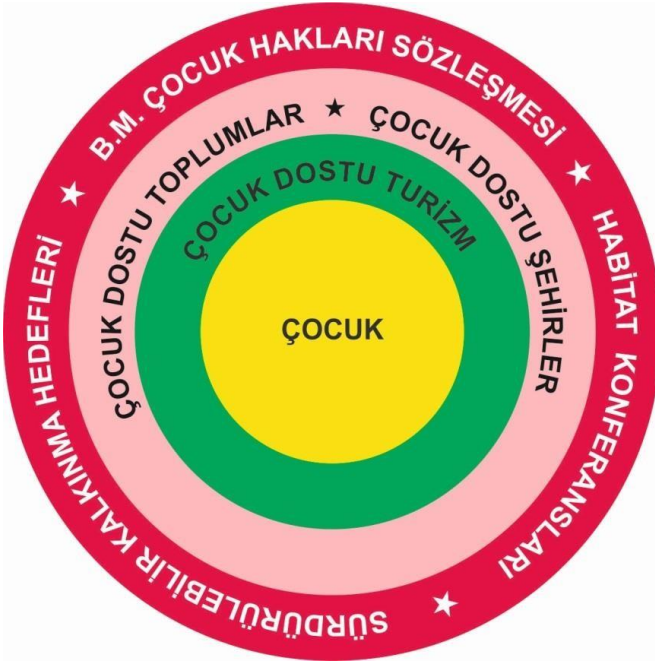
Şekil 1. Çocuk Dostu Turizmin Altyapısı

Günümüzde Çocuk Hakları Sözleşmesi temel alınarak dünyada belirli ölçütlere göre seçilen şehirlerde ,Çocuk Dostu Şehir Olma' yolunda projeler başlatılmıştır. Böylelikle yerel, ulusal ve uluslararası ortamlarda olumlu bir şehir imajı yaratılarak öne çıkan şehirler arasında yer alınabilir (Toksümer vd.: 2011, 18). Bu şekilde olumlu bir şehir imajı yaratıldığında, bu şehir ve toplumlar aile ve çocuk dostu turizmde tanınır duruma gelebilirler ve ülke turizmüne önemli katkıda bulunabilirler. Aşağıda şekil 1'de çocuk dostu turizmin altyapısında görüldüğü gibi, çocuk dostu bir toplum veya çocuk dostu bir şehir olmanın özünde Çocuk Hakları Sözleşmesi'nin yanısıra sürdürülebilir kalkınma hedefleri, Habitat konferansları gibi metinlerde yer alan hükümlerin uygulanması bulunmaktadır.