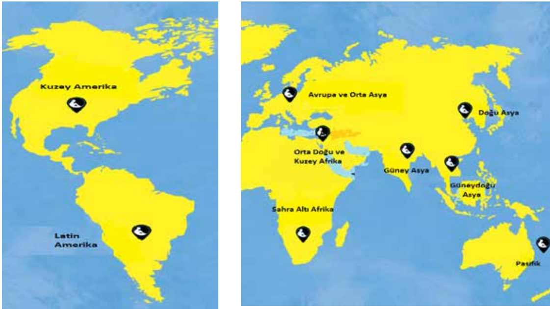
Şekil 2. 2016 Yılı İtibariyle CYCAT Eyleminin Gerçekleştiği Bölgeler