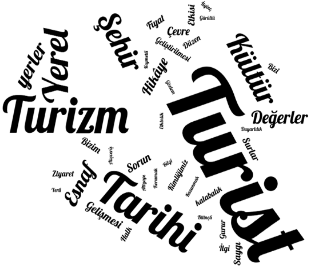
Görsel 13: Kelime Bulutu Analizi

Bu çalışmada yarı yapılandırılmış görüşmeler sonucunda katılımcıların en çok kullandığı ifadelerin kelime bulutu analizi yapılmıştır. Analizi sonucu görsel 13'te verilmiştir.