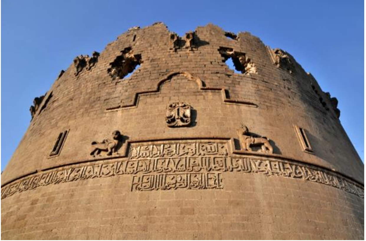
Fotoğraf 1: Diyarbakır Surlarının en çok bilinen ve ziyaret edilen burcu olan Keçi Burcu Kaynak: (Diyarbakır İl Kültür ve Turizm Bakanlığı).

Diyarbakır'ı tanımlayan en önemli maddi kültürel varlık olan surlar, dünyadaki en uzun surlardan biri olarak bilinmektedir. Çin Seddi'nden, Antakya surlarından ve İstanbul surlarından sonra gelmektedir. Ancak, Diyarbakır surları bu diğer surlardan farklı olarak, üzerindeki yazıtlar, burçları ve bezemeleriyle görkemli bir yapıya sahip olmaktadır (Çatalbaş, 2012). Şehrin eskiden bu surların içinde inşa edildiği belirtilmektedir. Ancak zamanla nüfus artışıyla birlikte şehir, ihtiyaçları karşılamakta zorlanınca, surların dışına taşınarak, Suriçi ve Yenişehir olarak ikiye ayrılmaktadır. Diyarbakır surları, Roma döneminden itibaren bölgeye egemen olan çeşitli medeniyetlerin etkisi altında kalmaktadır ve Bizans, Abbasi, Mervan, Selçuklu, Artuklu, İnallı, Nisanlı, Eyyubi, Akkoyunlu ve Osmanlı dönemlerinde önemini korumuş ve onarılmıştır (Atan, 2007).