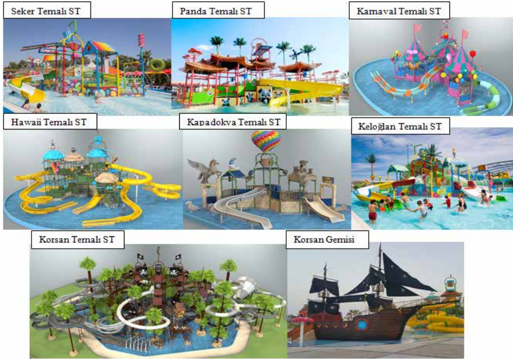
Şekil-6: Temalı - İnteraktif Oyun Kuleleri ve Çeşitleri