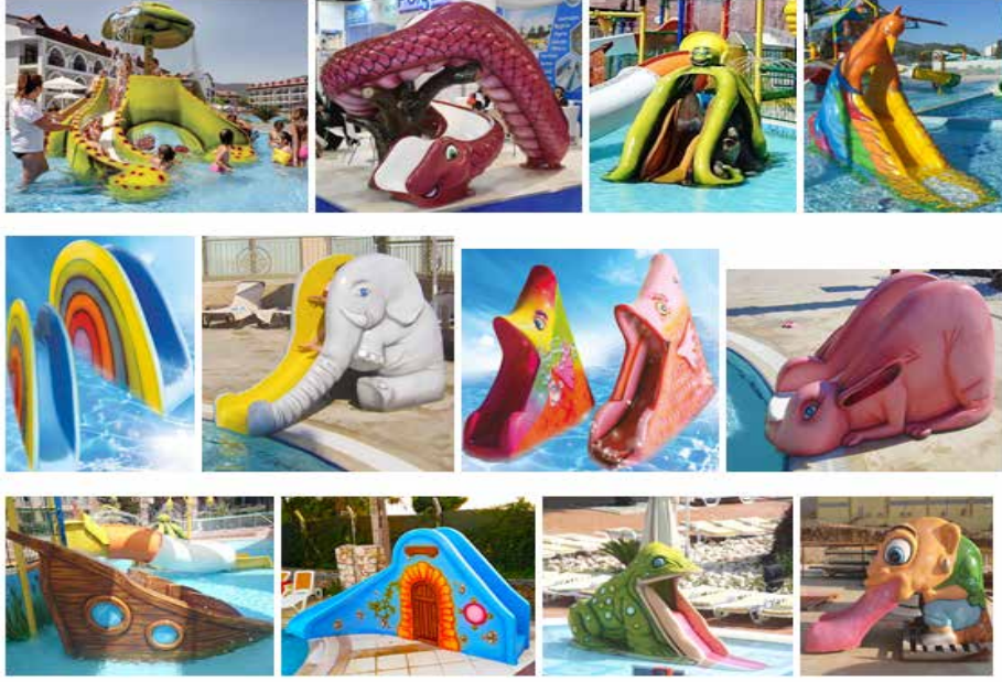
Şekil-2: Animasyon Kaydırak Çeşitleri