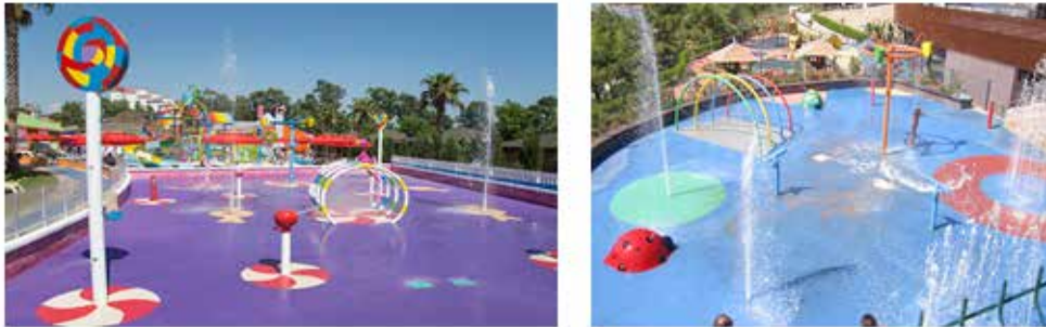
Şekil-3: Sulu Oyun Alanları ve Ürünleri

Şirketin çocuklara yönelik olan ikinci ürün grubu, animasyon kaydıraqları grubudur. Animasyon kaydıraqlar, çocukların korku yaşamadan güvenli bir şekilde suya alışmalarını ve eğlenceli vakit geçirmelerini sağlamak üzere farklı çeşitleri bulunmaktadır. 2 ile 7 yaş grubu arasındaki çocuklara hitap eden bu kaydıraqlar, çocukların yetişkinlerin denetiminde kaymalarına imkân sağlamaktadır. Animasyon grubu kaydıraqlar kendi içinde oniki farklı çeşidi bulunmaktadır. Bunlar yukarıdaki Şekil-2'deki görsellerden görüleceği üzere sırasıyla; ahtapot kaydırak, yılan kaydırak, mini ahtapot kaydırak, anka kuşu kaydırak, mini gökkuşağı kaydırak, fil kaydırak, melek balığı kaydırak, tavşan kaydırak, küçük korsan gemisi kaydırak, minilay kaydırak, kurbağa kaydırak ve tepegöz kaydırak olarak çeşitlendirilmiştir.