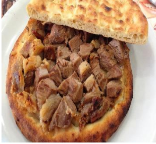
Görsel 10: Büryan Kebabı

Yemek kültürü olarak zengin bir mutfağa sahip olan Siirt ilinde et çok önemli bir yer tutmaktadır. Hayvancılık bakımından ihtisaslaşan bölgede elde edilen ürünler doğal yollarla elde edilmektedir. Buharda uzun saatler pişen Büryan Kebabı, hamurla pilavın eşsiz birleşimini bir araya getiren Perde Pilavı, mahalli ağızda Pirtik adı verilen Siirt Köftesi, özellikle serin havalarda tercih edilen Sarımsaklı Köfte, mahalli ağızda Şişe Şirten olarak bilinen ve kış aylarında tercih edilen Ayrırlı Yarma, mahalli adı Cokat olan Mumbar, pekmezin eşsiz lezzetini sunan Varak Kek, Gebole, Aside, Rayoşu Meketip ve İmçerket önemli gastronomik unsurlardır (siirt.ktb.gov.tr).