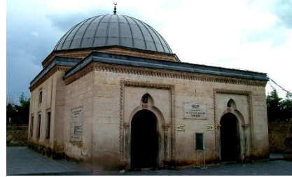
Görsel 5: Veysel Karani Türbesi