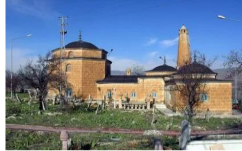
Görsel 6: İsmail Fakirullah Türbesi