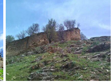
Görsel 9: İrun Kalesi