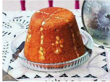
Görsel 11: Perde Pilavı