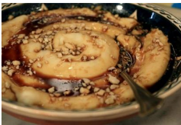
Görsel 13: Gebole