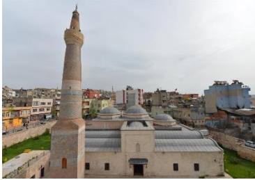
Görsel 3: Ulu Camii

Din ve astronomiye büyük katkısı olan İbrahim Hakkı'nın Hocası İbrahim Fakirullah için inşa ettiği yapı Aydınlar merkez olmak üzere Tillo sınırları içerisinde yer almaktadır. Biri büyük biri küçük iki holden oluşan yapının en önemli özelliği "Kalet-ül Ustad" olarak ifade edilen yağma taşların oluşturduğu ve duvardaki 40x50 cm. ebadındaki pencereden gece ve gündüzün eşit olduğu 21 Mart gün doğan güneşin ilk ışınları türbe kulesinin penceresine vurmasıyla hocası İsmail Fakirullah Hazretlerine ait mezarın baş tarafını aydınlık vermesidir (siirt.ktb.gov.tr).