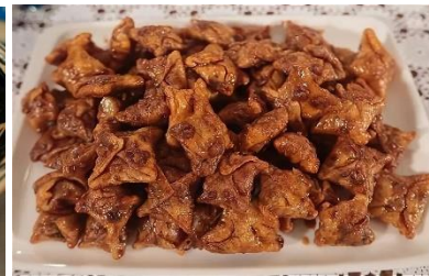
Görsel 14: Rayoşu Meketip