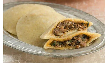
Görsel 15: Siirt Köftesi