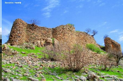
Görsel 8: Kormas Kalesi