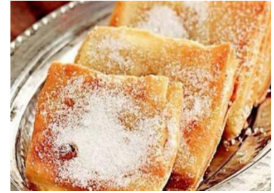
Görsel 12: İmçerket