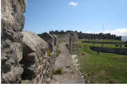
Görsel 7: Derzin Kalesi

Şirvan ilçesinin 40 km uzaklığında inşa edilen yapının en ilgi çeken yönü sarp dağların zirvesinde kurulmuş olmasıdır. (siirt.ktb.gov.tr)