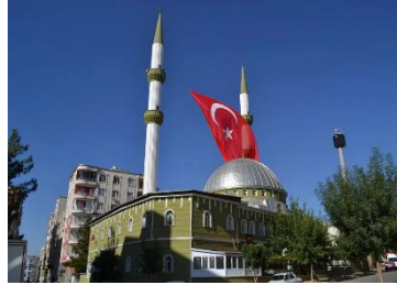
Görsel 4: Cumhuriyet Camii